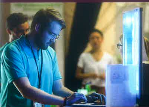
Am Siemens-Stand konnten die Besucher erfahren, welche Möglichkeiten LOGO! und Simatic IOT2000 im Bereich der privaten Automatisierung bieten